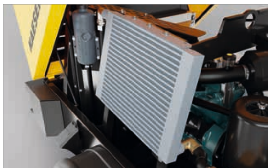
Postenfriador de aire comprimido